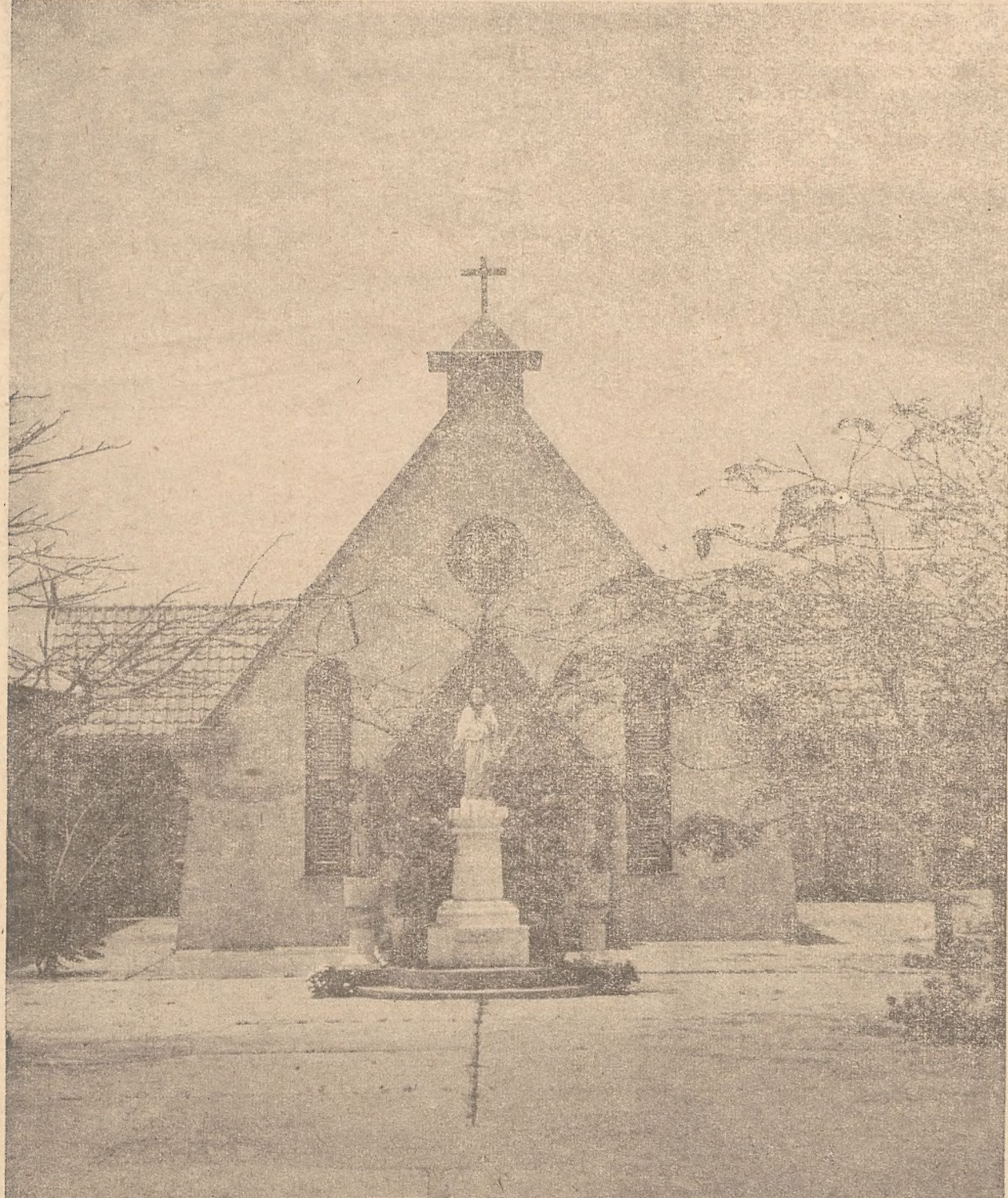
CAPILLA DI LEPROSERIA ZA QUITO.